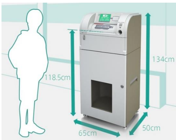
▲ペットボトル減容回収機 「ボトルスカッシュ (DRV-100T)」