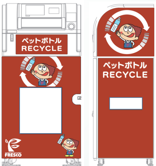
▲外装イメージ（正面／側面）