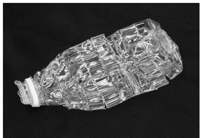
▲プレ裁断圧縮方式により減容したペットボトル