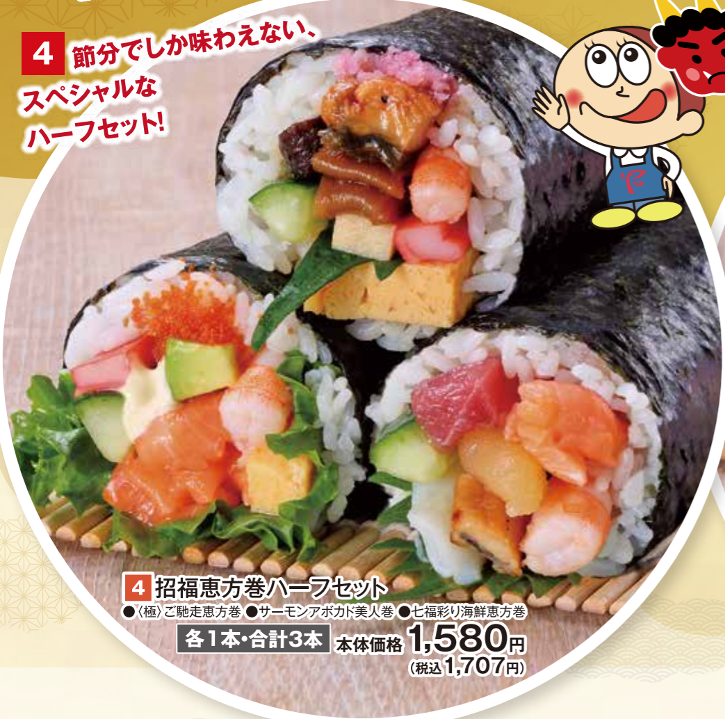
4 招福恵方巻ハーフセット ●〈極〉ご馳走恵方巻 ●サーモンポカド美人巻 ●七福彩り海鮮恵方巻 各1本・合計3本 本体価格 1,580円 (税込1,707円)