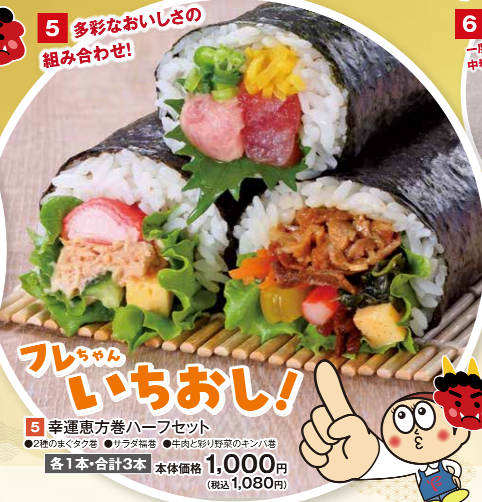
フレちゃん いちおし! 5 幸運恵方巻ハーフセット ●2種のまぐタク巻 ●サラダ福巻 ●牛肉と彩り野菜のキンパ巻 各1本・合計3本 本体価格 1,000円 (税込1,080円)