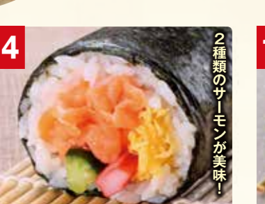
2種類のサーモンが美味!