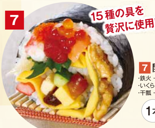
7 15種の具を 贅沢に使用!