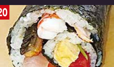
20 11種の味が1つになった、 贅沢な逸品!