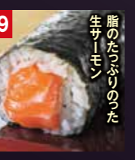
19 脂のたっぷりつた 生サーモン