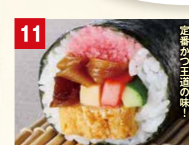
定番かつ王道の味!