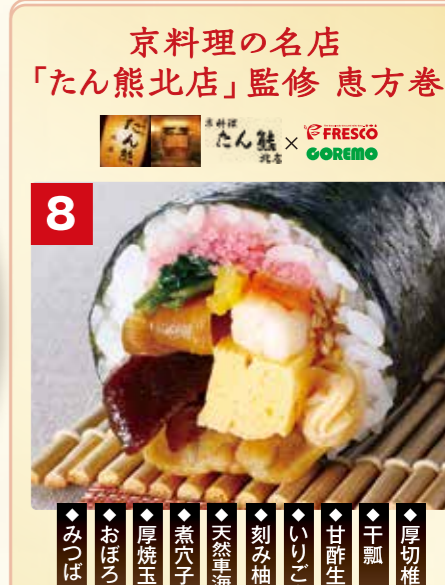
京料理の名店 「たん熊北店」監修 恵方巻 FRESKO GOREMO 8 恵方巻 ◆厚切椎茸 ◆干瓢 ◆甘酢生姜 ◆いりごま ◆刻み柚子 ◆天然筆海老 ◆煮穴子 ◆厚焼玉子 ◆おぼろ ◆みつば 先着 200本 限り 8 たん熊北店監修 恵方巻 1本 本体価格 1,780円 (税込1,923円)