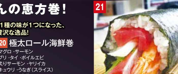
見た目も味も、 大迫力!