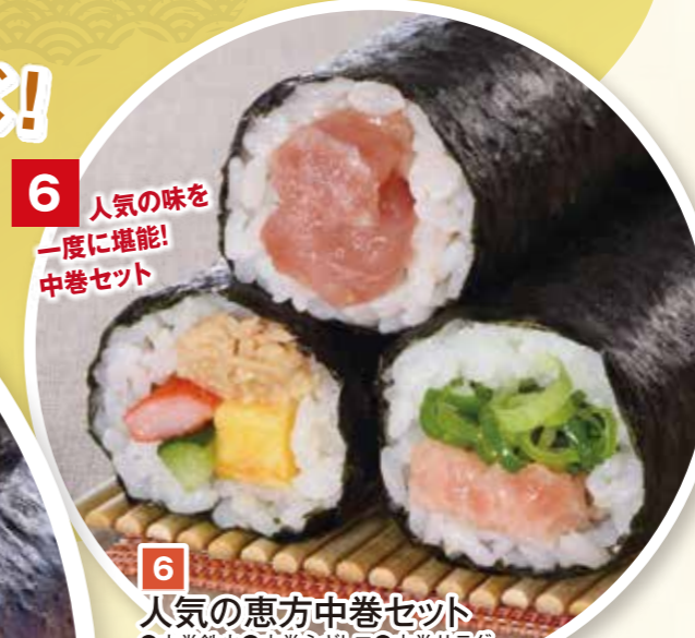
6 人気の恵方中巻セット ●中巻鉄火 ●中巻ネギトロ ●中巻サラダ 各1本・合計3本 本体価格 1,100円 (税込1,188円) ※中巻は、単品での販売商品もご用意しております。