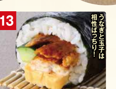
うなぎと玉子は 相性ばっちり!