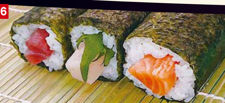
16 ハーフセット ・生マグロ鉄火太巻・ブリ大葉太巻 ・生サーモン太巻 各1本・合計3本 本体価格 880円 (税込951円)

掲載商品以外もご用意いたしております。※全商品ワサビ抜きです。ご予約限定商品は、節分当日 店頭販売していない場合がございます。詳しくは店頭にてご確認ください。※詳しくお申込方法につきましては、裏面のご予約票をご覧ください。※掲載価格は、本体価格と参考税込価格を併記しております。※掲載写真は、イメージも含んでおり、実際の商品とは多少異なる場合がございます。ご了承くださいませ。その他、ご要望・ご質問等ございましたら、スタッフまでお申し付けください。