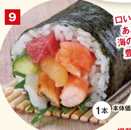
9 口いっぱい あふれる、 海の幸の 豊かな味わい!