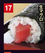
17 鮮度こだわった 生マグロ