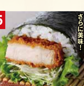
ソースで食べると さらに美味!