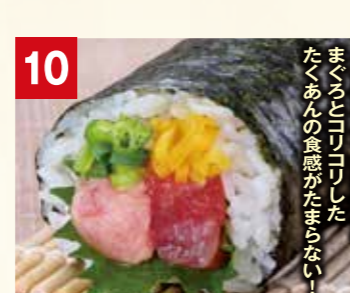
10 まぐろと たくあんの 食感がたまらない!