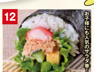
お子様にも人気のサラダ巻!