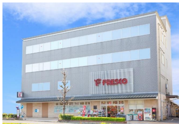
<株式会社ハートフレンド 本社>