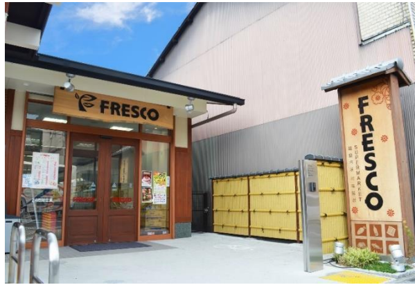
<左：フレスコ堀川店(京都市上京区) 右：フレスコ東山安井店(京都市東山区)>