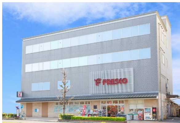
<株式会社ハートフレンド 本社>