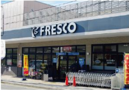
>フレスコ御園橋店