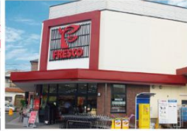
>フレスコ新之栄店