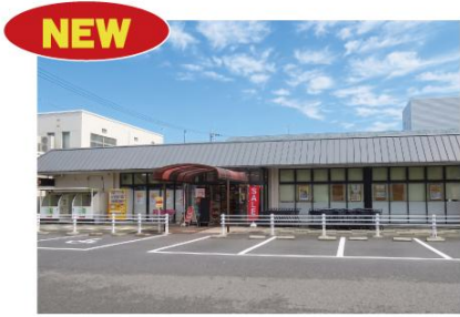
フレスコ向陽店 滋賀県大津市向陽町 5-1