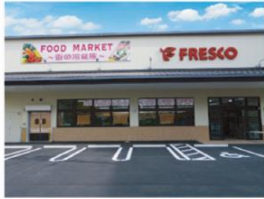
>フレスコ五条壬生川店