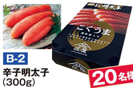
B-2 辛子明太子 (300g)