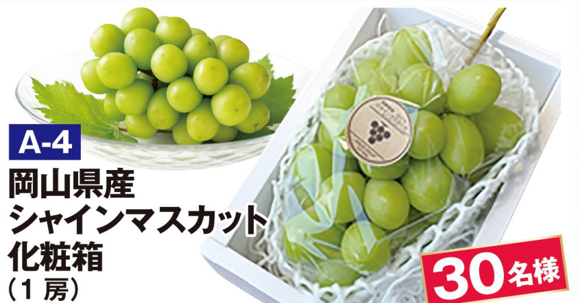
A-4 岡山県産 シャインマスカット 化粧箱 (1房)