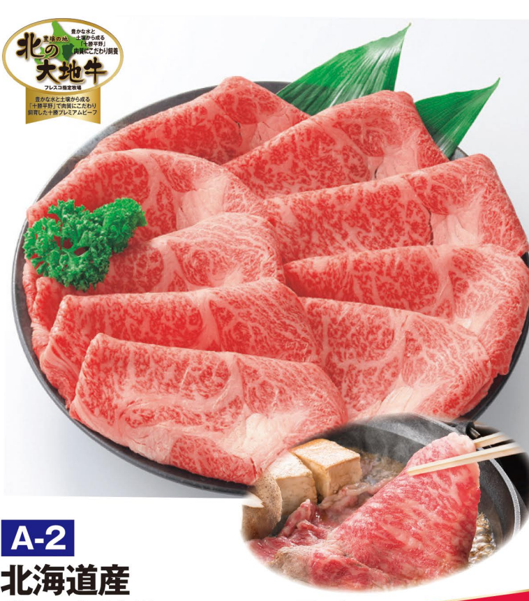
A-2 北海道産 北の大地牛ローススライス (400g)