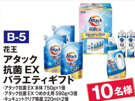
B-5 花王 アタック 抗菌EX バラエティギフト ・アタック抗菌EX本体 750g×1個 ・アタック抗菌EXつめかえ用 590g×3個 ・キューキュットクリア除菌 220ml×2個