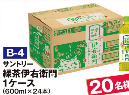
B-4 サントリー 緑茶伊右衛門 1ケース (600ml×24本)