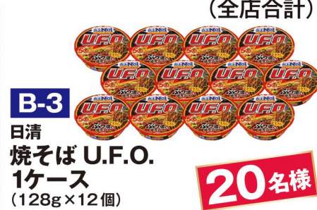
B-3 日清 焼そば U.F.O. 1ケース (128g×12個)