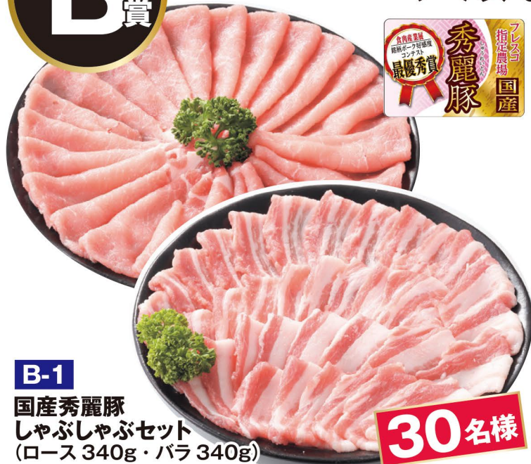
B-1 国産秀麗豚 しゃぶしゃぶセット (ロース 340g・バラ 340g)