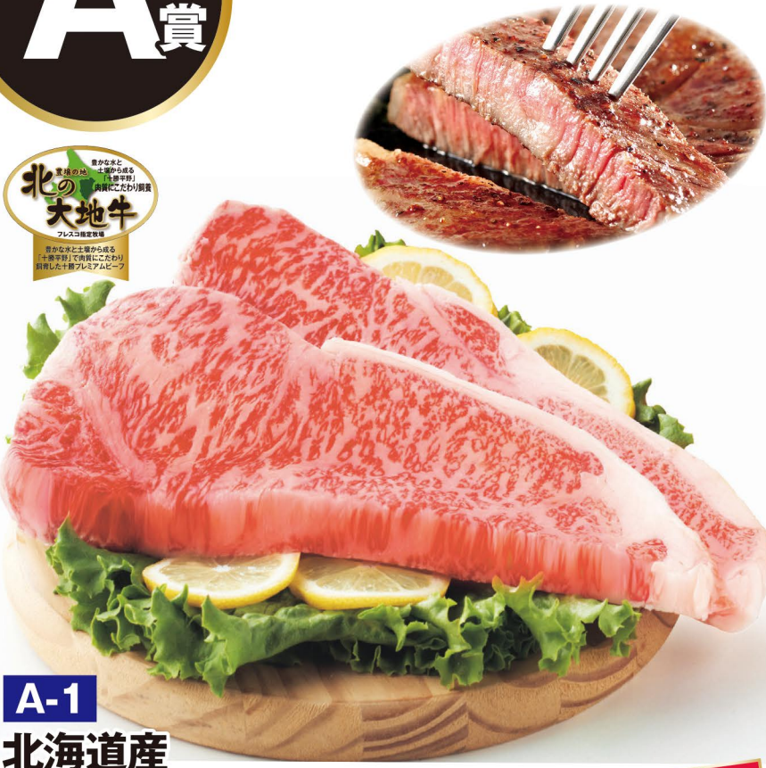
A-1 北海道産 北の大地牛ロースステーキ (200g×2枚)