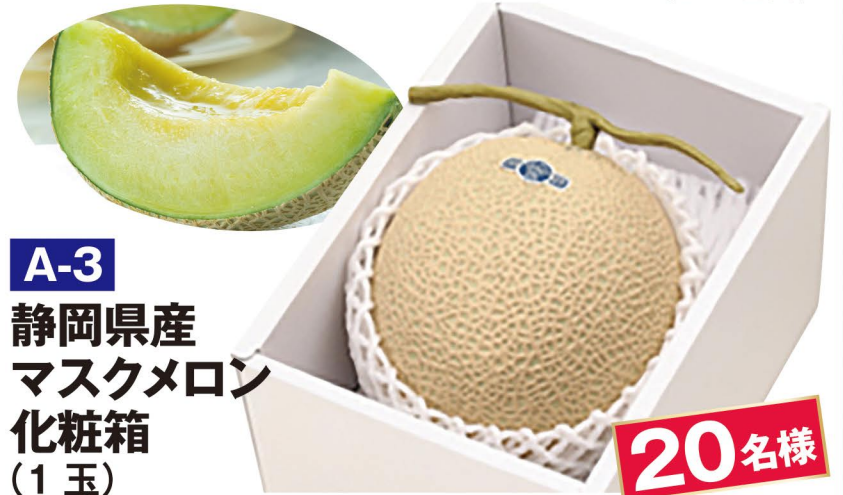
A-3 静岡県産 マスクメロン 化粧箱 (1玉)